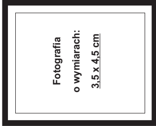
(nie wykraczać poza ramkę wewnętrzną)